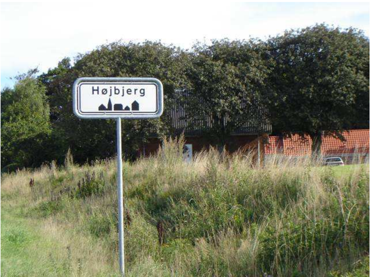
Højbjerg en Landsby ved A 26.