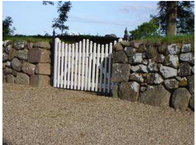
Kirkegårdsdiget med indgangslåge ved Højbjerg Kirke