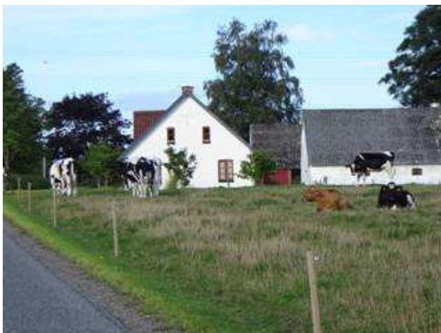
Der findes stadigvæk køer i Højbjerg området