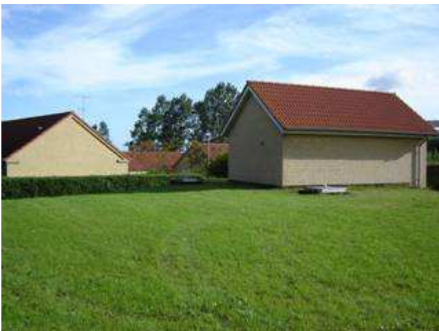
Et blik mod den nye bebyggelse i Højbjerg