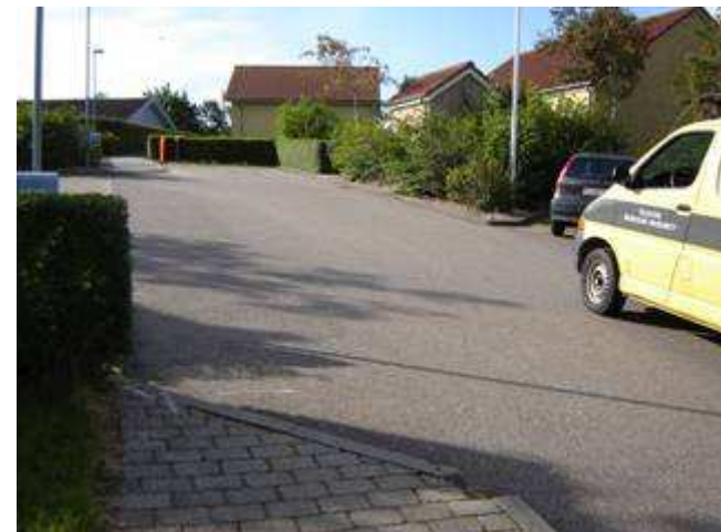
Boligvejen i Udstykningen Lerskrænten