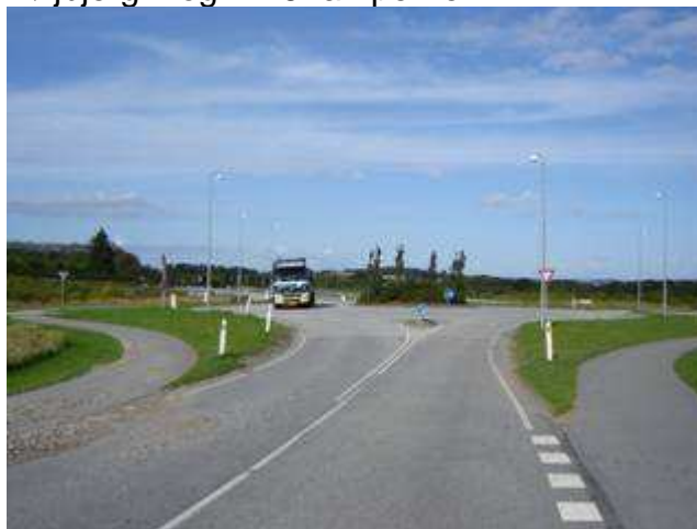
Den nye rundkørsel – Rødkærsbro – Højbjerg – og A 26 ramperne.