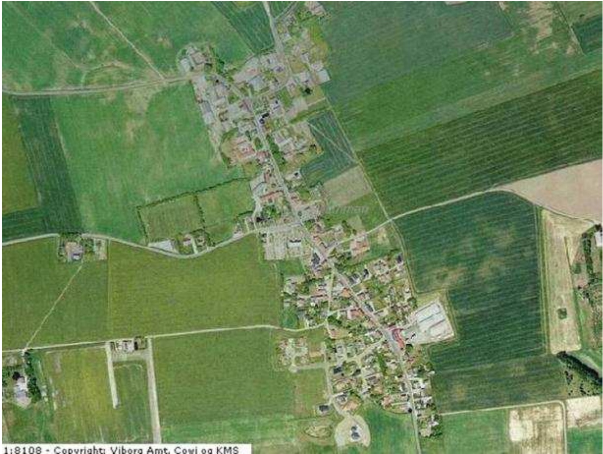
Luftfoto af Landsbyen Mammen og nærmeste omegn.