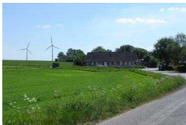
Vindmøller er også en del af billedet i området.

Nøddelund samarbejder på flere områder sammen med Sahl og Gullev. Således at der er visse fælles ting, som man kan hjælpe hinanden med – erfaringsmæssigt.