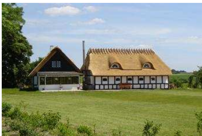
En renoveret ejendom - mellem Nøddelund og Sahl

Kommunekort - Nøddelund er placeret i det sydøstlige hjørne af Bjerringbro Kommune – og den nye Viborg Storkommune.