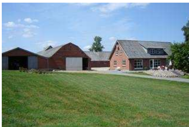
En af gårdene i Nøddelund.