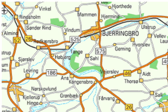
Kort, der viser Sahl – med overordnede veje