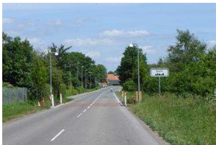
Indkørsel til Sahl