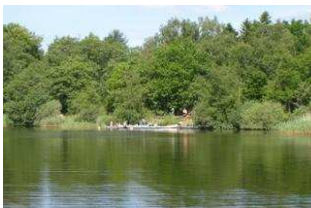
Naturen er fantastisk omkring Sahl – her fra Tange sø.