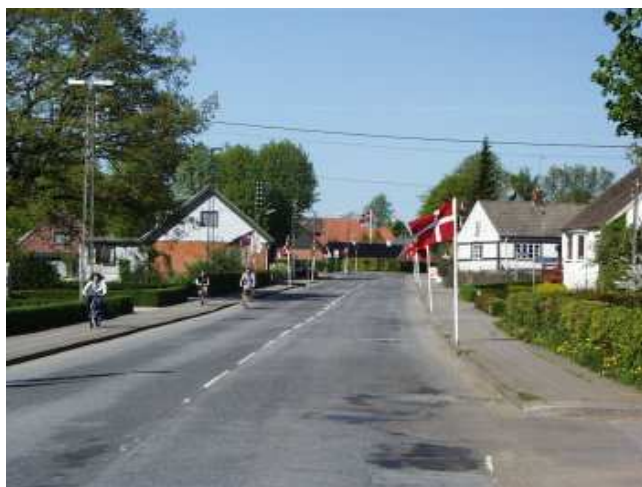
Et bybillede fra Sahl