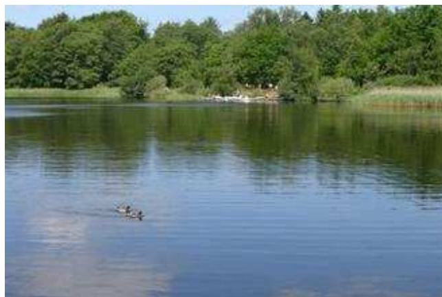
Tange sø – når vi kommer fra Ans mod Sahl