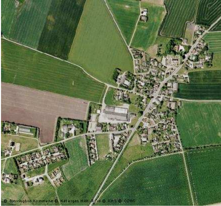
Landsbyen Sahl set fra luften