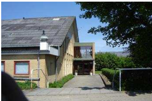
Sahl Minihal - Indgangen