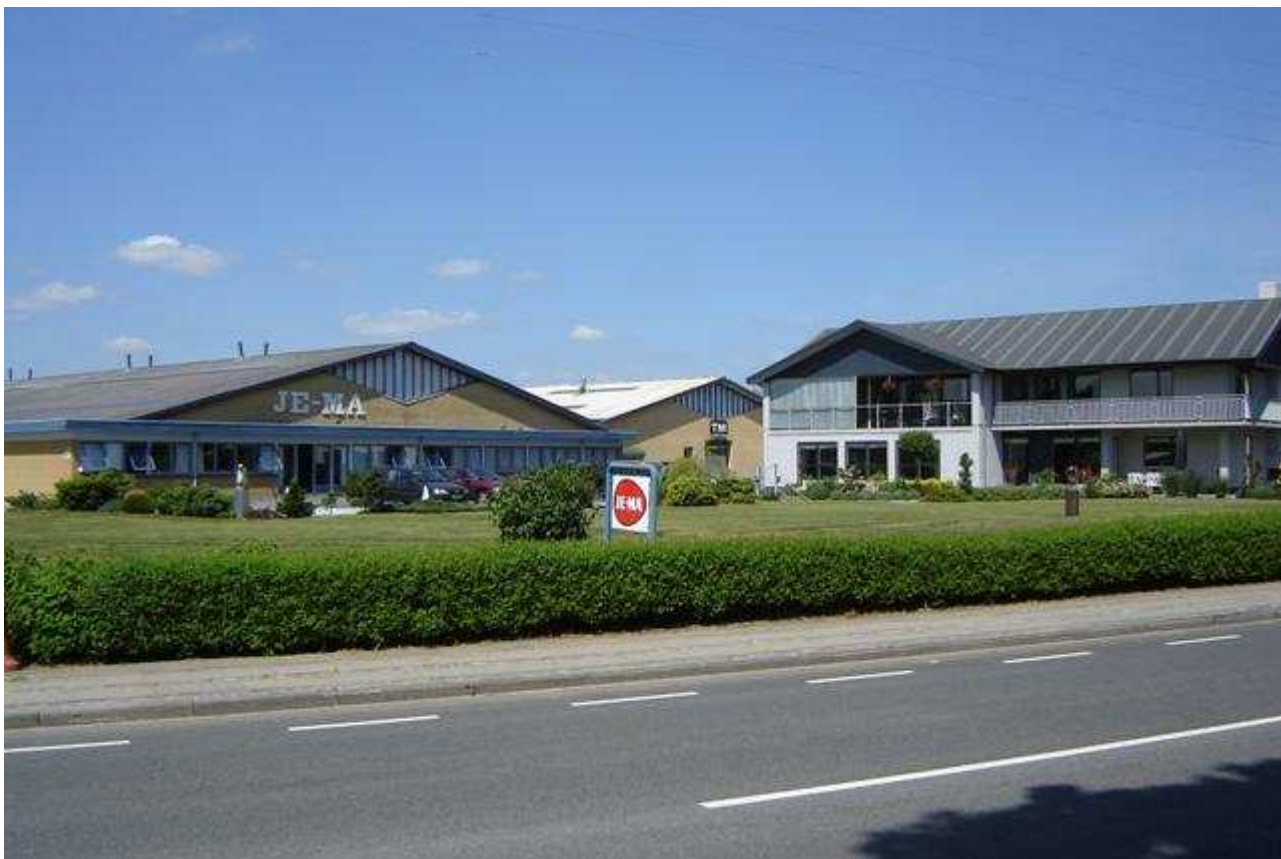
Byens større virksomhed – Maskinfabrikken JE-MA